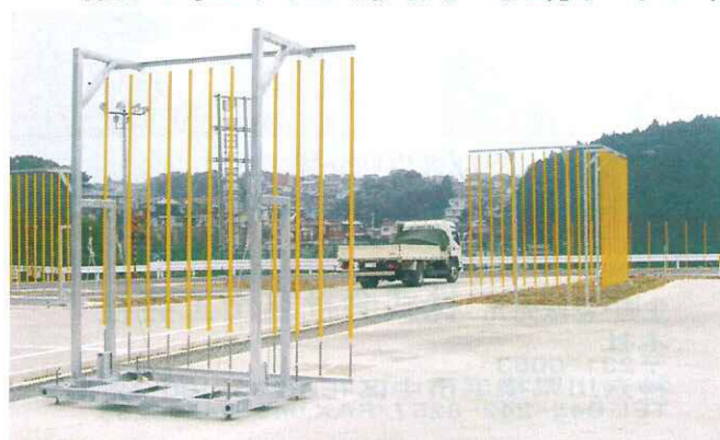
縦列駐車用(後方可動タイプ)