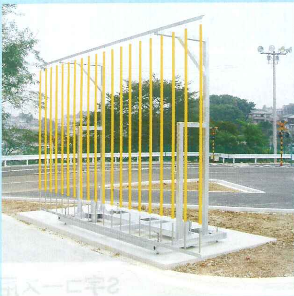
5m用可動障害物(方向変換、クランク)