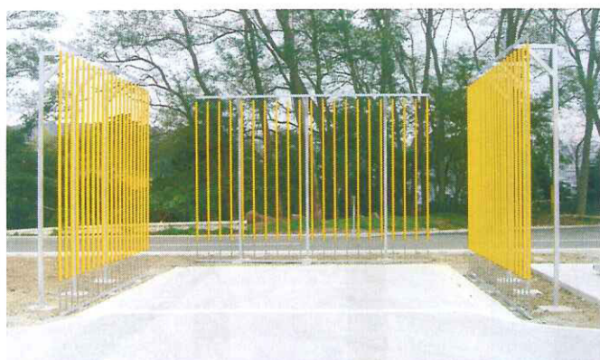
方向変換用(固定タイプ)