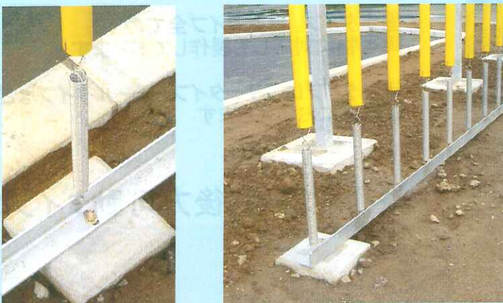
下部アングル及びスプリング