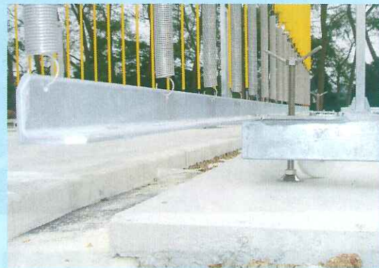
可動障害物固定調整アジャスター