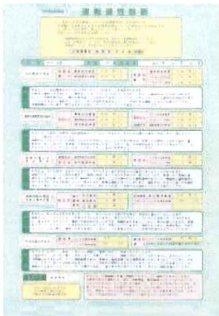
運転適性診断表(標準タイプ) B4、A4サイズがあります。